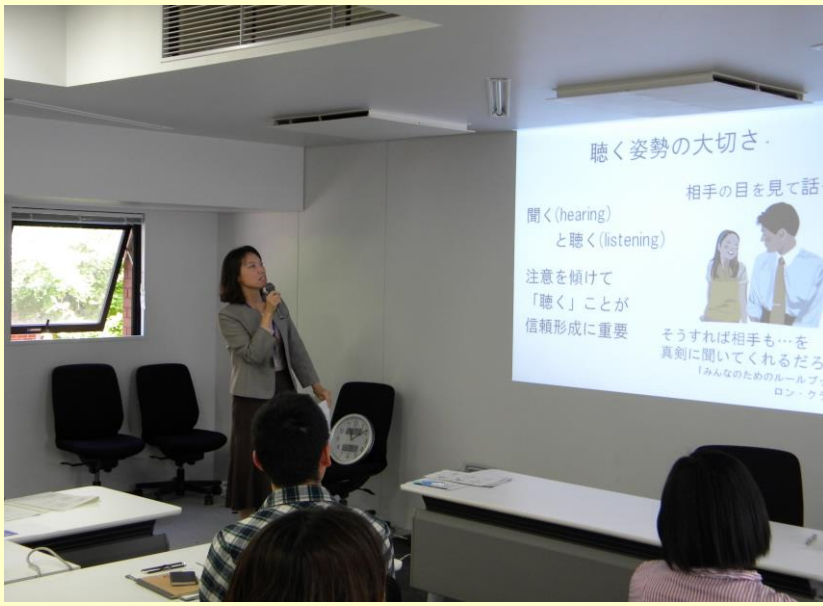
本郷での「なんでも相談ワークショップ」の様子 (関連記事 2ページ)