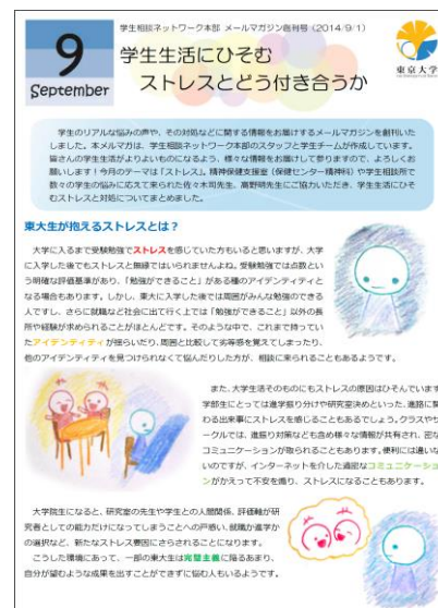
学生向けメールマガジン創刊号

去年の教職員向けメールマガジンに続いて今年度9月から学生向けメールマガジンも配信しました。作成には学生の方も協力して頂いて、学生の悩みやや困りごとにより近づけるように意見や提案をしていただき、実際原稿やイラストを書いていただいたり、レイアウトやデザインにもかかわっていただきました。